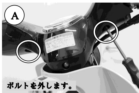
ボルトを外します。

※本文中や図中に出てくる丸囲み数字は前ページの部品構成内容表の部番に対応しています。