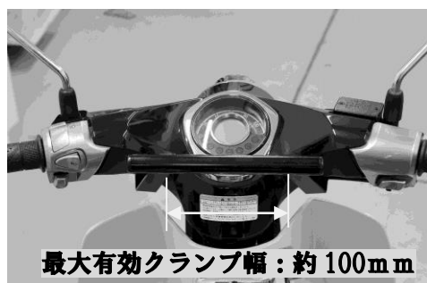
最大有効クランプ幅：約100mm