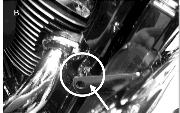
年式により本体①とフレームの間に付属カラー⑦を入れる