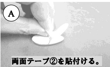
両面テープ②を貼付ける。