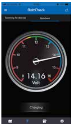
エンジン稼働中の状態

電圧メーター バッテリーの電圧がリアルタイムで確認できます。現在のバッテリー電圧の状態をわかり易く色と数値で分類。過度な電装品の使用や発電系・充電系トラブル等の早期発見に役立ちます。 ■ 左側レッドゾーン…過小電圧 ■ イエローゾーン…電圧が低め ■ グリーンゾーン…正常電圧(エンジン停止時) ■ ブルーゾーン…充電中(エンジン稼働中) ■ 右側レッドゾーン…過充電